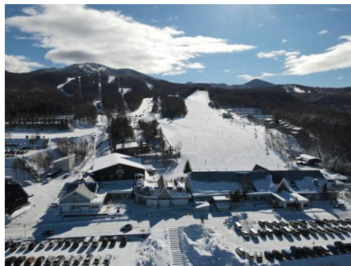
那須ガーデンアウトレット×ハンターマウンテン塩原

那須ガーデンアウトレットは、今後も那須エリアのハブ施設として、地域との連携を図り、今後もさらなるロイヤルリゾート「那須」の魅力を伝える企画や取り組みを行ってまいります。